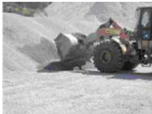
مرحله ۳- لودر سرتاسر توده کوچک حرکت کرده، بیل را پایین آورده و برای تشکیل نمونه توده کوچک را به عقب می‌کشد.