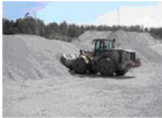
مرحله ۱- بیل لودر تقریباً ۱۵۰ mm بالاتر از سطح زمین وارد دپو می‌شود.