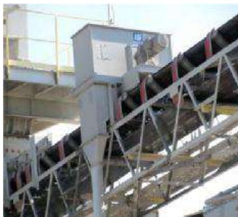
شکل ۲- نمونه‌برداری خودکار از نوار نقاله