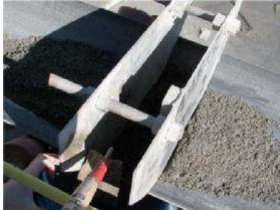
شکل ۱- الگوی نمونه‌برداری از نوار نقاله

یادآوری- نمونه‌برداری از نوار به صورت اتوماتیک تا زمانی قابل قبول است که خروج مصالح از نوار به صورت پیوسته و کامل توسط بازرسی‌های منظم کنترل گردد (به شکل ۲ مراجعه شود).