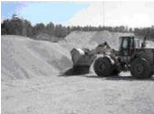
مرحله ۲- لودر مصالح را برای تشکیل توده به آرامی از بیل بیرون می‌ریزد.

۴-۱-۳-۵ در این مرحله، راننده بیل لودر خود را به اندازه‌ای که به توده کوچکی دست یابد بالا برده و به سمت جلو حرکت می‌کند، بدون اینکه اجازه دهد لاستیک‌های لودر روی سطح شیب‌دار توده نمونه‌برداری قرار گیرد. راننده بیل را تا حدود نیمی از ارتفاع توده کوچک پایین آورده، و به عقب حرکت می‌کند. بدین ترتیب سطح صافی برای نمونه‌برداری بدست می‌آید (به شکل ۳ مراجعه شود). بیل لودر فقط یک بار باید توده کوچک را به عقب بکشد. این سطح صاف یک جزء پایدار و ایمن برای بدست آوردن نمونه نماینده تأمین می‌کند.