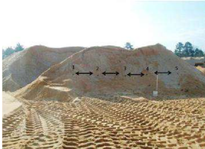
شکل ۴- نمونه برداری سنگدانه ریز از دپو با استفاده از لوله نمونه برداری

۱-۴-۵ برای نمونه برداری از سنگدانه های درشت در واگن های قطار یا کشتی ها باید از امکانات و تجهیزات ماشینی در مکان های تصادفی و در سطوح متفاوت استفاده کرد.