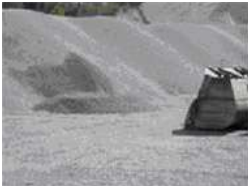
مرحله ۴- نمونه‌برداری